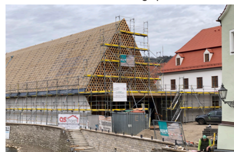
Kulturhalle Christoph Willibald Gluck

Mit dem Bau der Kulturhalle wird ein Ersatz für die Kulturfabrik geschaffen. Die Fertigstellung ist für Mitte 2020 geplant.