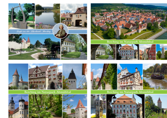
Postkarten sind im Tourismusbüro erhältlich