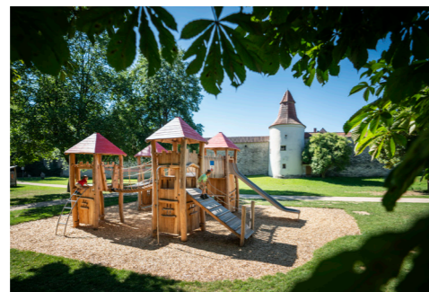
Spielplatz im Hollnberger Park

Mit den Arbeiten am Reichenauplatz wurde 2019 begonnen. Der Pettenkoferplatz folgt 2020. Die Fußwege sind anschließend barrierefrei.