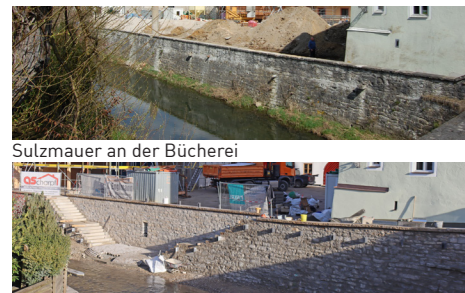
Sulzmauer an der Bucherei

Der Spielplatz im Hollnberger Park ist seit 2015 beliebter Treffpunkt und wird gut genutzt. Der gesamte Grüngürtel wird gepflegt und dient als innerstädtischer Naherholungsraum.