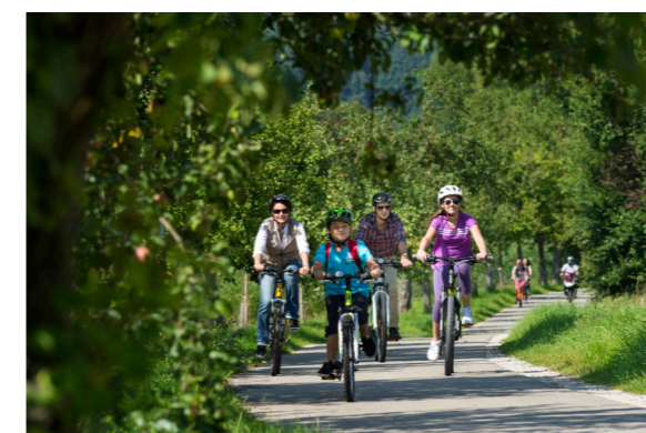
Radeln rund um Berching