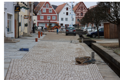
Baumaßnahmen am Reichenauplatz

Im Zuge der Maßnahmen zum barrierearmen Ausbau der Innenstadtwege wird ein stimmiges Lichtkonzept für die angrenzenden Gebäude in Abstimmung mit den Eigentümern installiert.