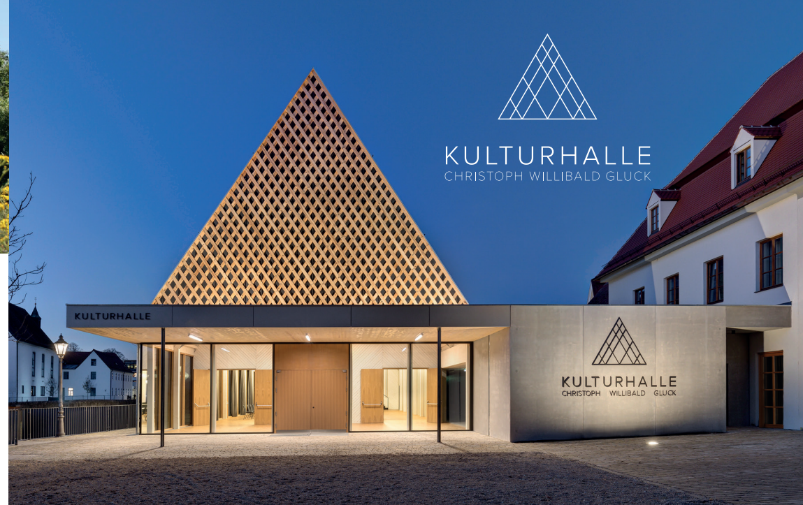
Kultur, Tagen und Feiern in Berching – die historische Stadt im Naturpark Altmühltal