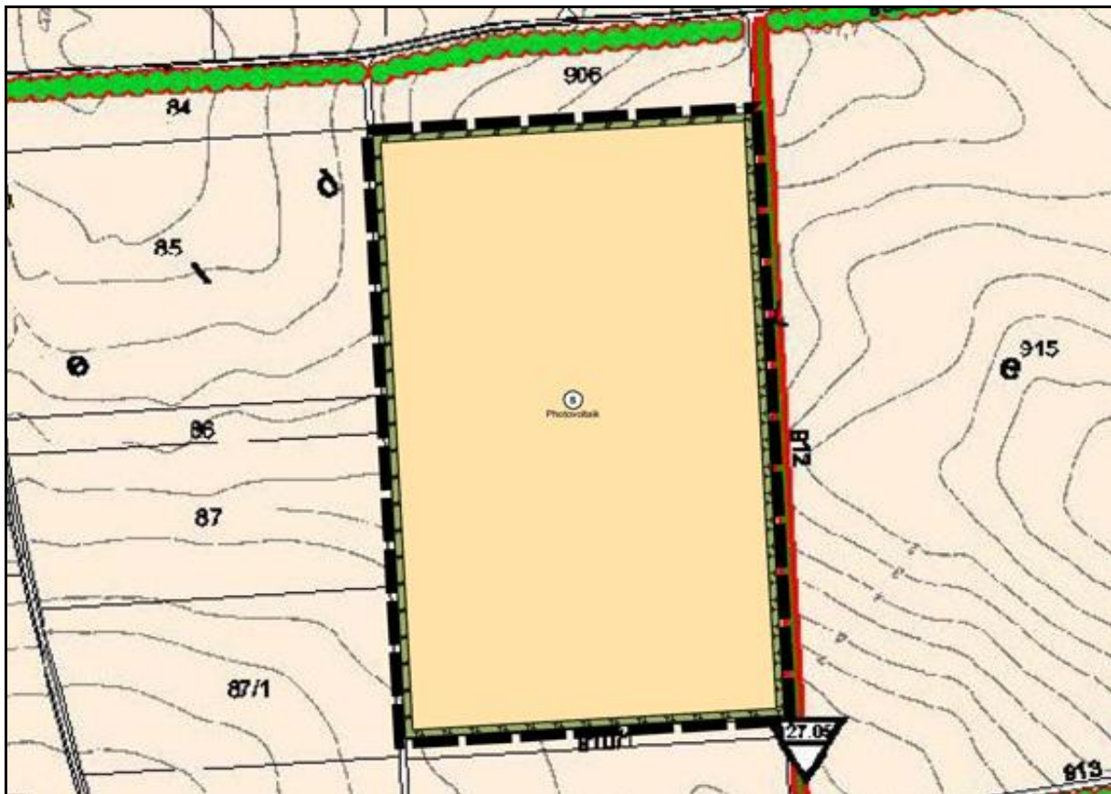
Abbildung 1: Umgrenzung der geplanten PV-Anlage bei Rudertshofen

Auf einer landwirtschaftlich intensiv genutzten Ackerfläche auf der Jurahochfläche südöstlich von Rudertshofen ist der Bau einer 10,08 Hektar großen Freiflächen-PV-Anlage geplant. Auf den dortigen Äckern wurden im Jahr 2022 Getreide und Mais angebaut. Der Standort liegt im südöstlichen Gemeindegebiet von Berching (Landkreis Neumarkt i.d. OPf., Regierungsbezirk Oberpfalz). Es umfasst die Flurstücke mit den Flurnummern 908 und 909, Gemarkung Rudertshofen. Naturräumlich befindet sich das Plangebiet auf der Fränkischen Alb (nach Ssymank).