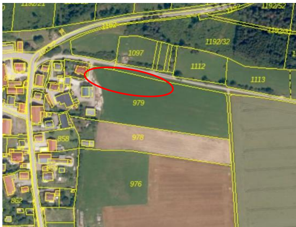
Luftbildkarte mit Verortung des Geltungsbereichs